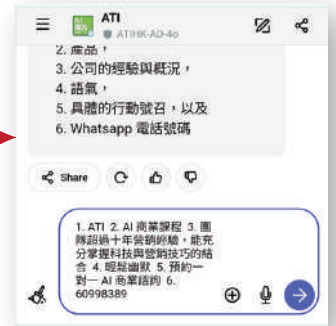
4. 根據AI的指示輸入相關資料